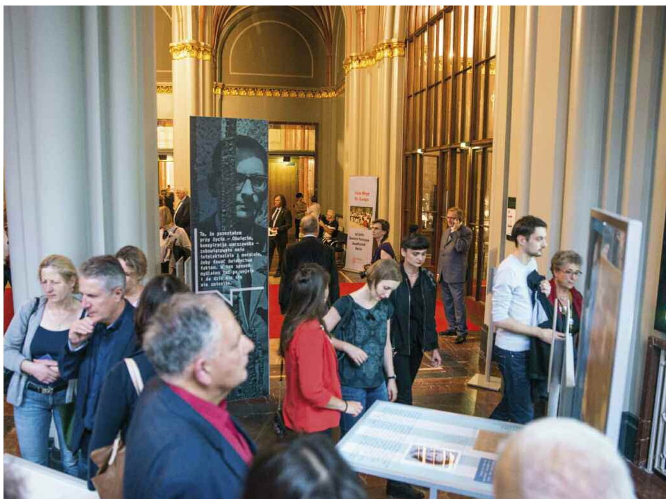
Eröffnung der Bartoszewski Ausstellung im Roten Rathaus in Berlin / otwarcie wystawy Bartoszewskiego w Czerwonym Ratuszu w Berlinie, 2018

o przejęcie koordynacji i organizacji projektu.