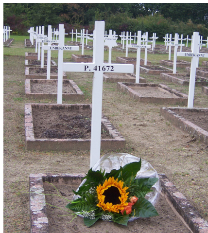
Das Grab von Zbigniew Walc. Auf dem Friedhof Grabfeld rechts, Reihe sieben, etwa in der Mitte. Erkennbar an seiner Häftlingsnummer: P. 41672

Heute ist die Gedenkstätte ein internationaler Erinnerungs-, Informations- und Begegnungsort mit einem neu errichteten Dokumentationszentrum, einer Dauerausstellung, öffentlichen Veranstaltungen und Bildungsangeboten für Jugendliche und Erwachsene. Zum Gelände gehört auch der Ehrenfriedhof, auf dem die Opfer des Massakers beigesetzt sind, so auch Nik.