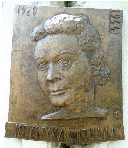
Gedenkstele mit Bronzerelief auf dem Gertraudenfriedhof in Halle (Saale)

Auf dem Gertraudenfriedhof in Halle liegt Krystyna Wituska anonym mit anderen 60 weiteren Hingerichteten. Die Stele trägt stellvertretend für alle Opfer Krystynas Porträt. Am 18. März 2010 wurde die junge Heldin posthum für ihre „besonderen Verdienste um die Unabhängigkeit Polens“ mit dem Kommandeurskreuz des Verdienstordens der Republik Polen ausgezeichnet. Nachdem wir ein Blumengebilde am Obelisk niederlegen, verlassen wir den Friedhof und fahren mit dem Bus zurück in Richtung Berlin, wo wir am Abend wieder eintreffen.